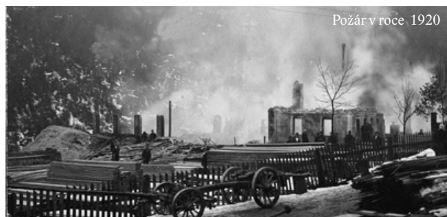
Požár v roce 1920