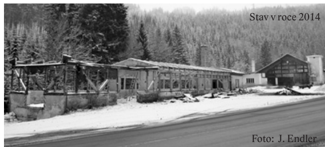
Stav v roce 2014