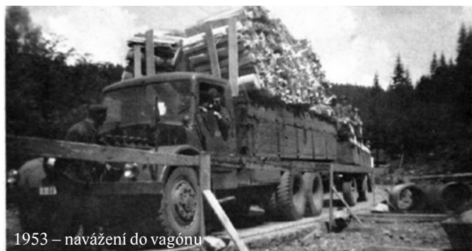
1953 – navážení do vagónu