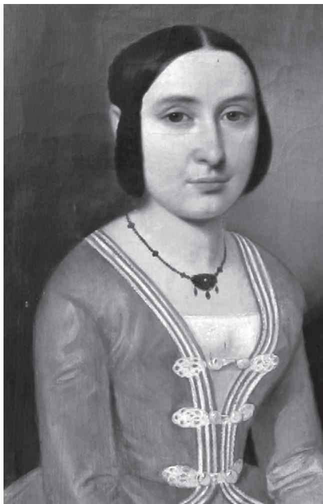
Karolina Světlá na olejomalbě J. Myslivečka z roku 1848