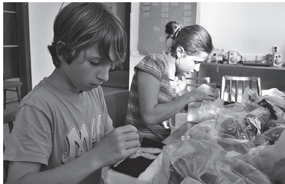
Technika suchého plstění ovčí vlny

Děti 1. ročníku se zapojily do projektu „Veselé zoubky“, který připravila Drogerie dm. Zhlédly video Jak se dostat Hurvínkovi na zoubek. Hravou formou se naučily, jak správně pečovat o svůj chrup. Dostaly taštičku s produkty péče