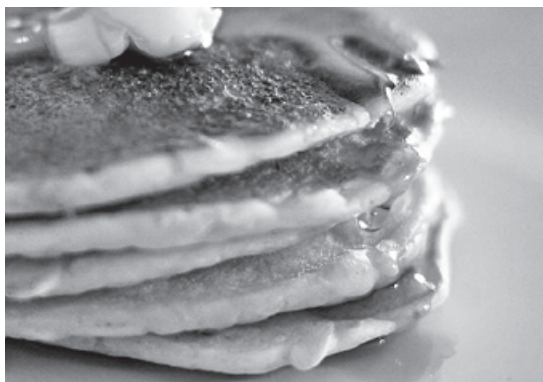
Lívance si udělejte jako dezert nebo hlavní jídlo

Rebarboru oloupeme, nakrájíme, přidáme k ní celou skořici a hřebíček a uvaříme doměkka ve vodě, kterou trochu osladíme a okyselíme. Před koncem varu vytáhneme skořici a hřebíček a polévku zahustíme smetanou smíchanou se lžící mouky. Polévku po přejití varem zjemníme kouskem másla a po vychlazení podáváme. Dle našich babiček se má rebarbora konzumovat pouze do svátku sv. Jana, pak prý obsahuje příliš kyseliny šťavelové.