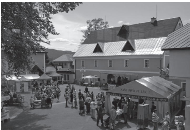
Areál sklárny při Sklářských slavnostech