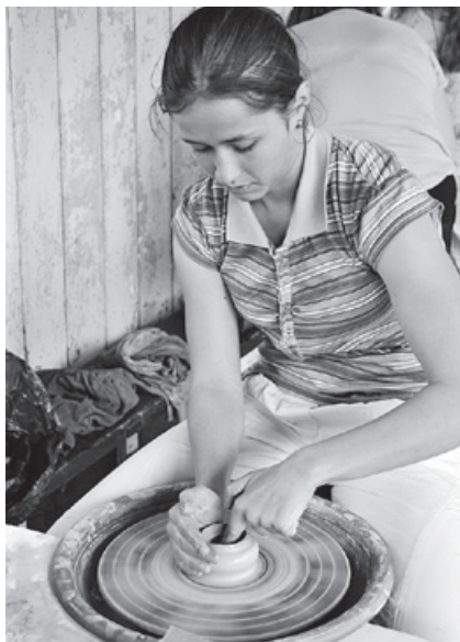
Práce na hrnčířském kruhu

výrobky, z nichž některý může sloužit jako pěkný dárek pro rodiče, ale i spoustu zážitků ze společně prožitých chvil a doufejme, že i pár návyků, jak lépe vycházet a spolupracovat s ostatními.