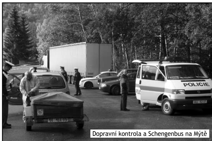
Dopravní kontrola a Schengenbus na Mýtě

Pracovníci Oblastní ředitelství SCPP Hradec Králové připravili tuto prezentační akci u příležitosti konání 13. speciálního kurzu pro integrovanou hraniční bezpečnost v rámci Střeoevropské policejní akademie (MEPA), kterého se pravidelně účastní zástupci středního a vyššího managementu cizineckých policií 8 evropských zemí (Rakouska, Maďarska, Spolkové republiky Německa, Polska, Slovenska, Slovinska, Švýcarska a České republiky).