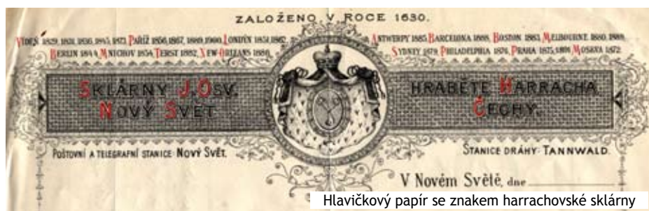
Hlavičkový papír se znakem harrachovské sklárny