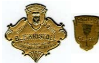
Etiketa HarrachGlas a ENDLER Glas (období II. svět. války)