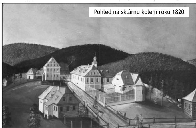
Pohled na sklárnu kolem roku 1820