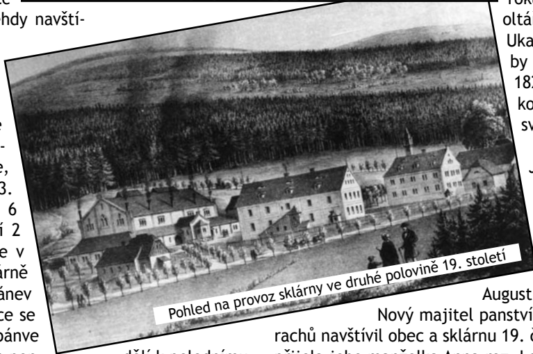
Pohled na provoz sklárny ve druhé polovině 19. století