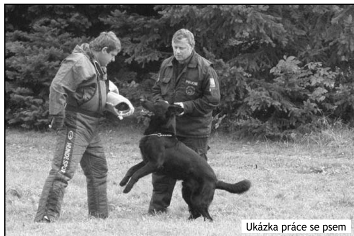
Ukázka práce se psem