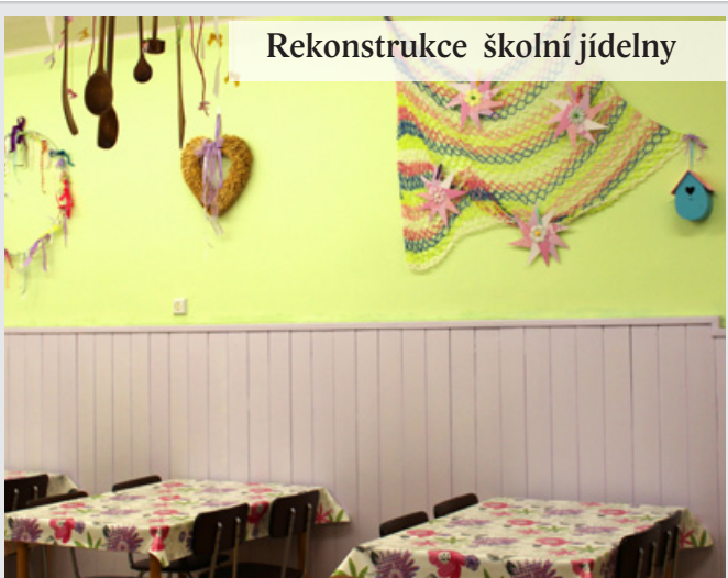
Rekonstrukce školní jídelny