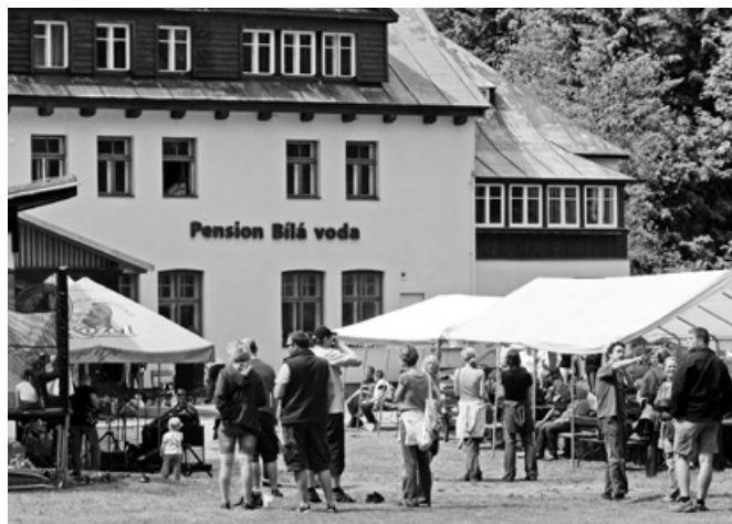
Areál pensionu Bílá voda

Přijměte srdečné pozvání na 2. ročník akce Svatojáclavské posezení, které se bude v letošním roce konat společně s akcí Odpad z nebe nepad. Obě akce proběhnou v sobotu 21. září v areálu harrachovského pensionu Bílá voda. Vše vypukne v 10.00 hodin soutěžemi pro děti, které za splnění všech dvanácti nenáročných úkolů budou sladce odměněny. Úkoly se budou týkat tématu ekologie, kde se děti budou zábavnou formou učit, že odpad skutečně z nebe nepad. Během soutěžení bude děti povzbuzovat i Václav Upír Krejčí,