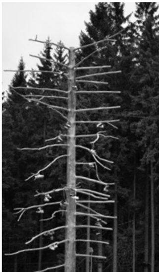
Botovník u bobové dráhy v Harrachově