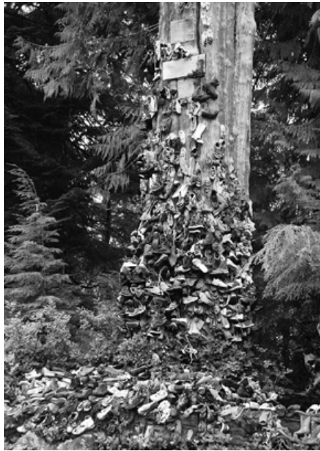
U cesty do Holbergu v Kanadě