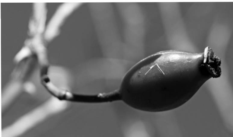
Plody šípkové růže ordinoval svým pacientům už sám Hippokrates

Šípky namočíme přes noc do vody a druhý den je v teže vodě, do které přidáme citrónovou kůru, uvaříme. Takto uvařené, měkké šípky propasírujeme, dochutíme solí, cukrem a necháme projít varem. Poté ji zahustíme moukou rozkvedlanou v mléce a znovu necháme projít varem. Polévka je chutná teplá i studená.