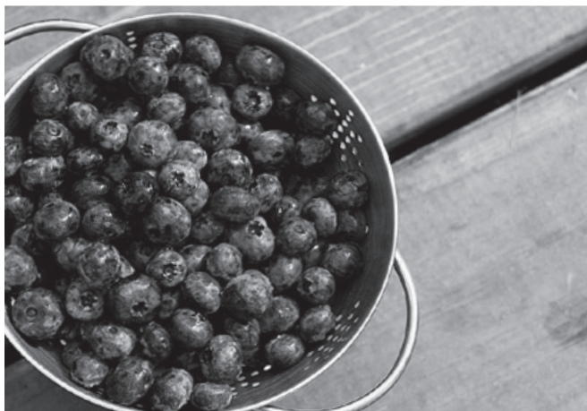
Borůvky jsou neobyčejně zdravá biopotravina

Nakrájenou cibuli zpěníme na sádle, přidáme očištěné a nakrájené houby, sůl, kmín a podusíme. Měkké houby zalijeme vodou nebo vývarem, přidáme rozetřený česnek, pepř a krátce povaříme. Na kostičky nakrájený chléb osmažíme na sádle, vložíme do talířů a zalijeme polévkou.