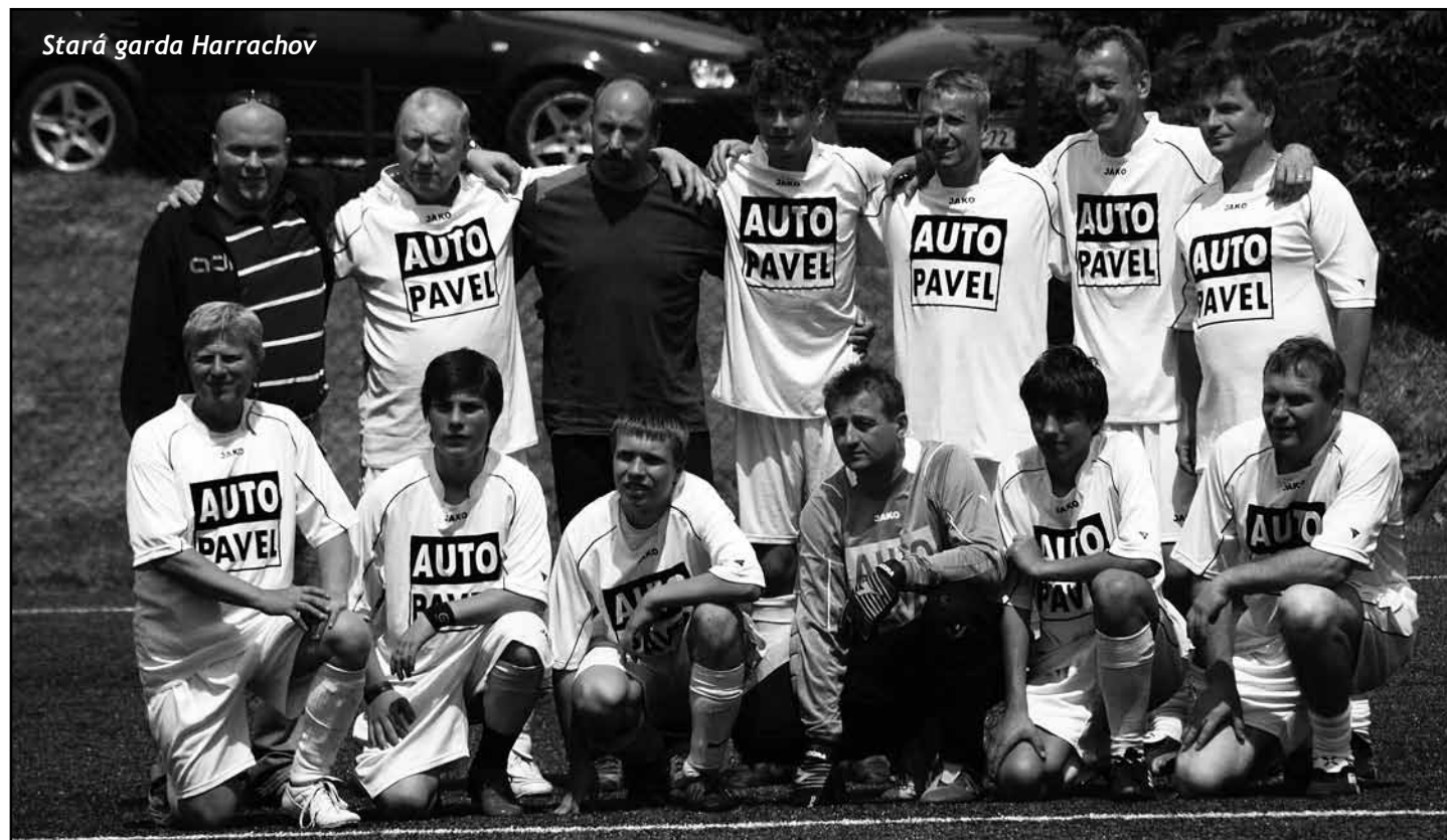
Stará garda Harrachov