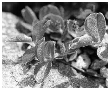
Vrba bylinná je nejnižší dřevinou rostoucí v České republice vůbec

Je nejmenším druhem vrby na světě. Jedná se o drobný keřík, který má načernalé plazivé kmínky, vejčité okrouhlé tmavozelené listy a kvete od července do srpna malými červenými jehnědami. Rostlina je nízkého vzrůstu a jelikož není schopná konkurovat vzrostlejšími rostlinám, vyskytuje se na neúrodných půdách jako např. na skaliskách, závětrných místech. Pro svou náročnost na vláhu jí nejvíce vyhovují místa, kde je během vegetace vyšší četnost srážek a velká relativní vzdušná vlhkost. V ČR se vyskytuje pouze v Krkonoších a v Jeseníkách a patří mezi kriticky ohrožené druhy.