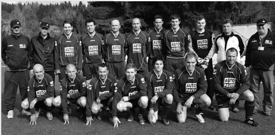
FK JISKRA HARRACHOV má za sebou první sezonu v I.A třídě.