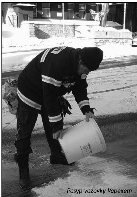
Posyp vozovky Vapexem

Ten den byl v dopoledních hodinách obvodním oddělením Policie nahlášen únik ropného produktu v blízkosti hraničního přechodu do Polska. Po ohlášení na semilský dispečink vyjela šestičlenná jednotka harrachovských hasičů směrem k lokalitě ohlášení. Při příjezdu na místo byl zjištěn únik oleje v délce zhruba pěti set metrů, okamžitě byla zahájena likvidace tohoto ropného produktu za pomoci posypu sor-