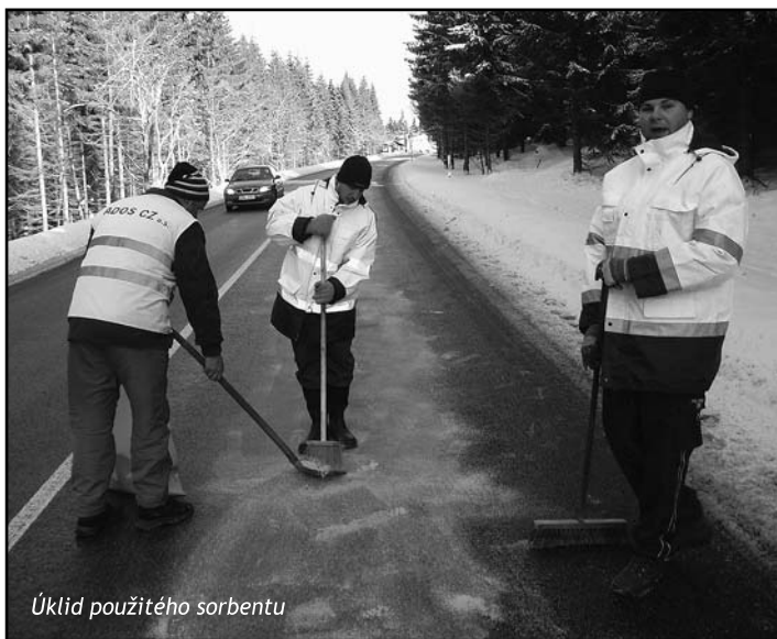
Úklid použitého sorbentu

Teplotně rekordní měsíc leden 2007 s sebou přinesl i rozmrazy v počasí. Tím nejvážnějším bylo řádění orkánu Kyrill v noci z osmnáctého na devatenáctý leden, jehož síla se nevyhnula ani Harrachovu. Druhým hasičským zásahem v tomto měsíci byla likvidace úniku ropného produktu po autohavárii.