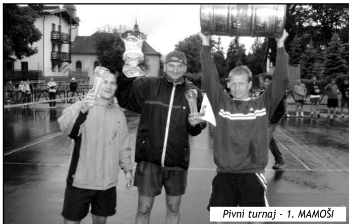
Pivní turnaj - 1. MAMOŠI

Již po pětadvacáté se na harrachovských nohejbalových kurtech sešli přeborníci z naší země za účelem klání v trojicích o pohár města Harrachova. Stalo se tak tradičně v první srpnovou sobotu, jež tentokrát vyšla na 4.8.2007.