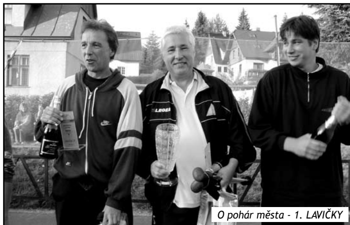
O pohár města - 1. LAVIČKY