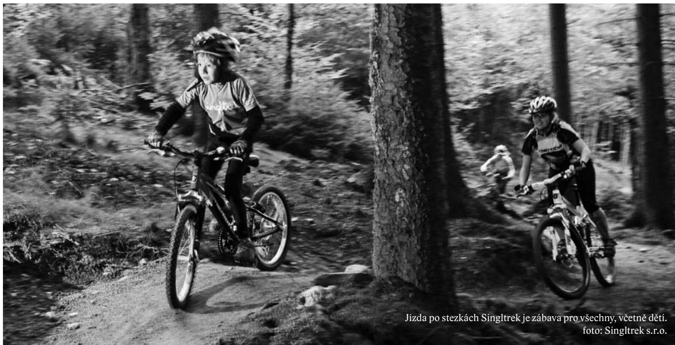
Jízda po stezkách Singltrek je zábava pro všechny, včetně dětí.

V Harrachově opět ožila myšlenka na realizaci tratí Singltreku. Pro ty, kteří nevědí, co si pod tímto slovem představit, tu máme vysvětlení, které pro vás připravil přímo projektant stezek Singltrek® Tomáš Kvasnička, který je tvůrcem tohoto pojmu, jenž vznikl slovní hříčkou ze spojení „single track“, což ve slangové angličtině používají jezdci na horských kolech: „Stezky Singltrek® jsou jednostopé, přírodě blízké rekreační stezky pro terénní cyklistiku. Jsou projektovány ve škále odstupňované náročnosti tak, aby byly přístupné nejen nadšeným cyklistům, ale široké veřejnosti, tzn. i pro rodiny s dětmi. Aby byly stezky Singltrek® dlouhodobě udržitelné, jsou do terénu umísťovány velmi pečlivě a jejich stavba podléhá přísným vnitřním standardům.“