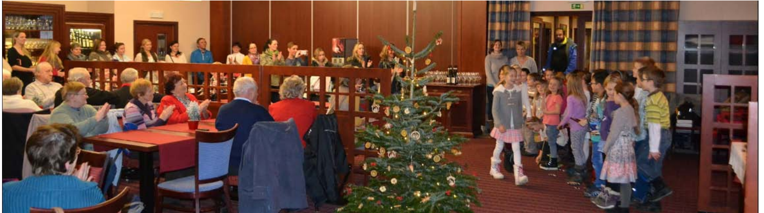
Předvánoční návštěva mateřské školky na městském úřadu