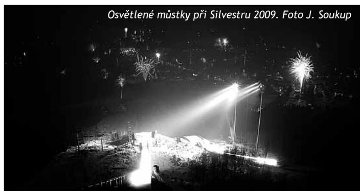
Osvětlené můstky při Silvestru 2009.