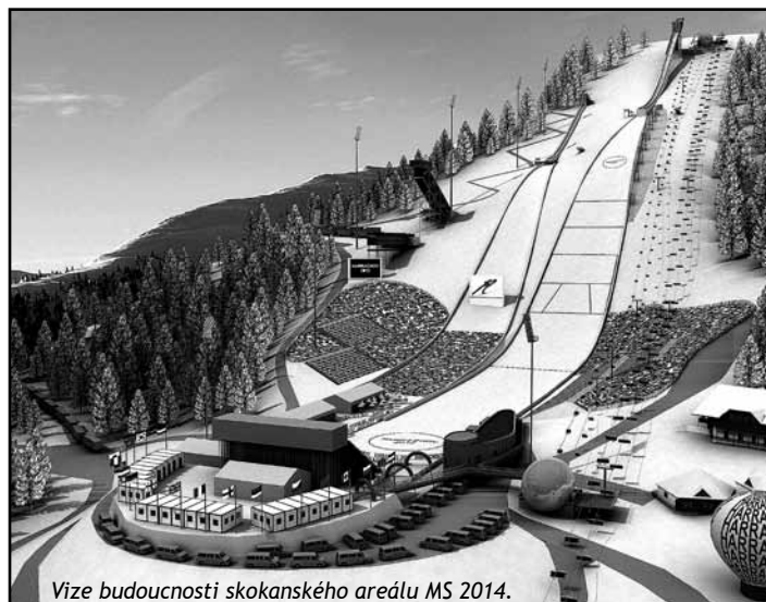
Vize budoucnosti skokanského areálu MS 2014.