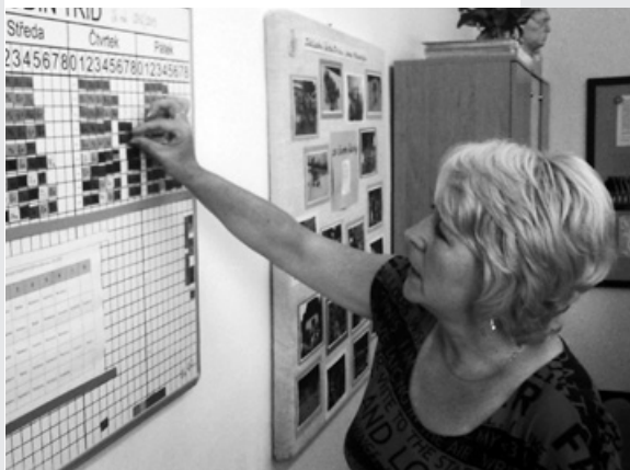
Nová paní ředitelka připravuje denní program pro děti

I kdybych měla sebelepší vize, bez dobrého týmu lidí a pedagogů bych nemohla dělat nic. Všichni u nás ve škole mají chuť do práce a jsou ochotni dělat mnoho dalších aktivit, a tím nemyslím jenom vzdělávání. Snažíme se pro děti připravovat různé programy, jezdilo se od IQ parku, do lanového centra, pořádala se školní akademie, cyklistické dny, sportovní olympiády a mnoho dalšího. To bychom rádi zachovali. Učitelská práce není o hodinách.