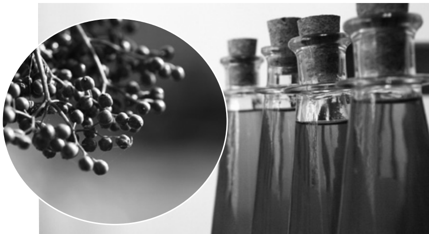
“Před heřmánkem smekni, před bezem klekni” - staré přísloví.

Bezinky vaříme v 1 l vody cca 10 minut. Poté bezinky propasírujeme přes jemné síto a do takto vymačkané šťávy přidáme cukr a vanilkový cukr, vaříme 5 minut, poté přidáme mletou kávu a znovu povaříme 5 minut. Do vychladlé šťávy přidáme rum, nalijeme do lahve a ponecháme v chladnu cca 2 měsíce.