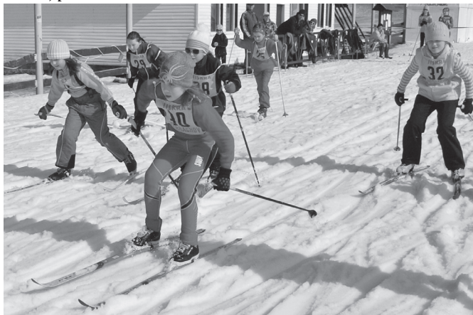
Všem ještě jednou děkujeme. Za ZŠ I. Port

V úterý 22. 3. 2011 uspořádala Základní škola Harrachov pro své žáky školní závod v běhu na lyžích volnou technikou. Závod se konal v areálu u Ski centra. Ačkoli sníh nebyl příliš kvalitní, počasí se nám vydařilo, slunečný den byl přímo „na objednávku“. Tak nám snad příznivci sportu prominou, že jsme dvakrát museli buď z organizačních důvodů (obsazenost tratí), nebo z důvodu špatného počasí přesunout termín konání závodu. Závodu se zúčastnilo celkem 79 žáků a všichni dojeli i přes některé malé kolize při sjezdu z kopce zdárně bez úrazu do cíle. Těší nás, že své ratolesti přišli povzbudit mnozí rodiče, příbuzní a známí.