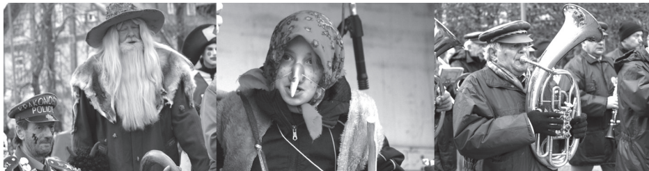
Další fotografie jsou k vidění na stránkách www.harrachov.cz v sekci fotogalerie