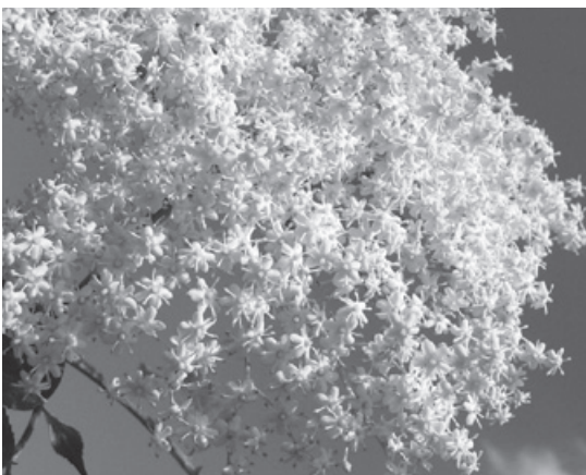
Květy bezu černého

200 g mladých kopřiv, stonek vopichu, cibule, máslo, 2 stroužky česneku, sůl, 1 l zeleninového vývaru nebo vývaru z kostí, 2-3 krajíce chleba. Kopřivy, cibuli a vopich podusíme na másle, přidáme utřený česnek se solí, zalijeme připraveným vývarem. Chleba