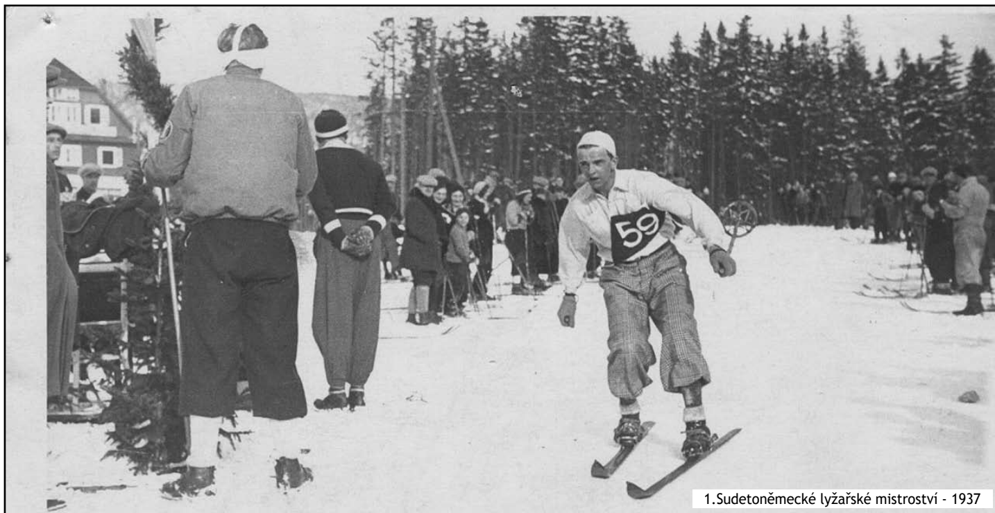
1. Sudetoněmecké lyžařské mistrovství - 1937