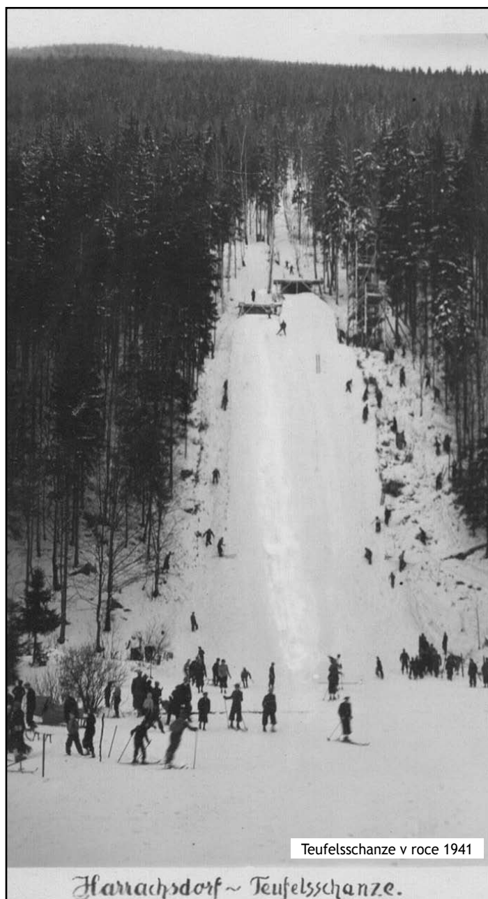
Teufelsschanze v roce 1941