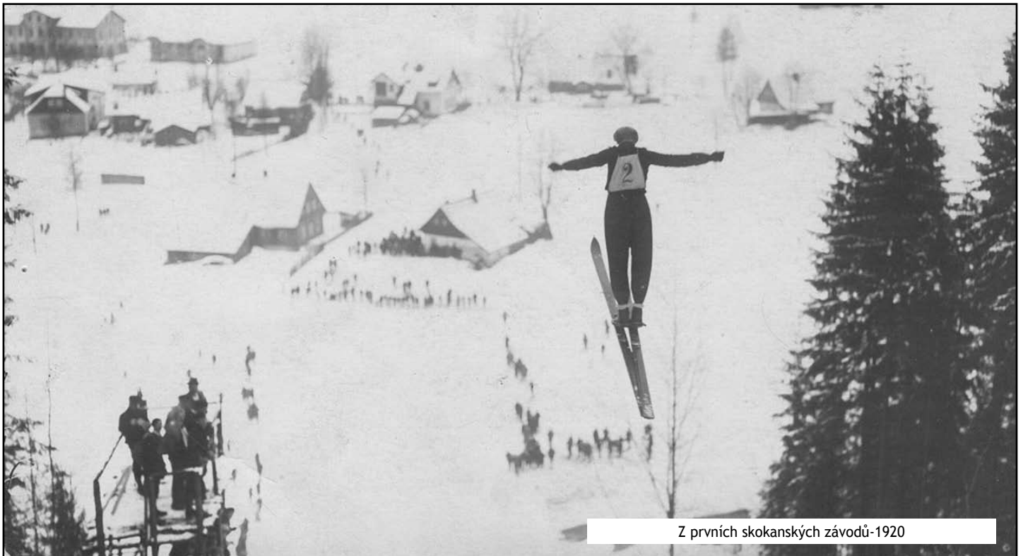
Z prvních skokanských závodů-1920

Vážení čtenáři Harrachovského zpravodaje, v minulosti jsme již několikrát zmiňovali historii skokanských můstků na Ptačinci. V dnešním historickém článku u příležitosti 100 let lyžování v Harrachově bych rád připomenul předválečnou historii skokanských můstků na Čertáku.