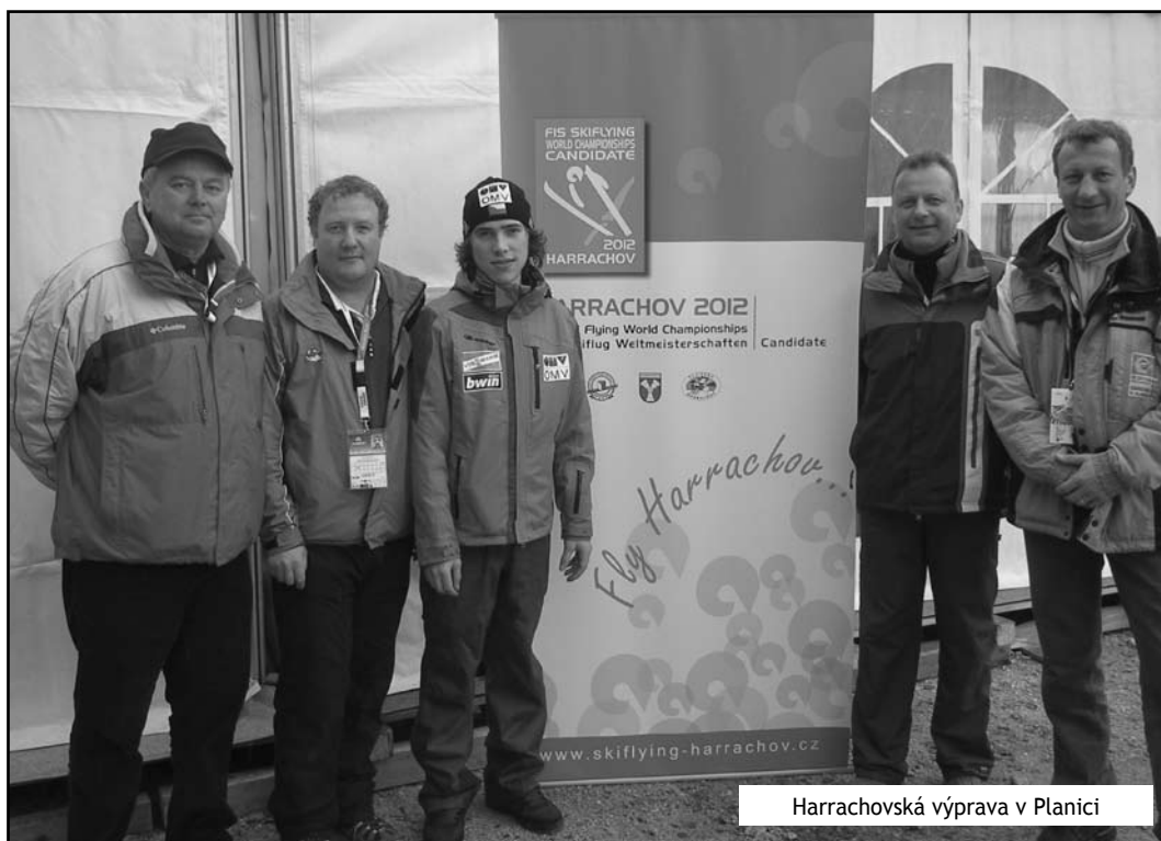
Harrachovská výprava v Planici

větru, rychlostí, výstroje, délky letů, křivek letů a podobně, že i ostatní členové sdružení KOP byli velmi udiveni. O takovýchto statistických údajích, které mohou samozřejmě ovlivnit průběh každého závodu, si můžeme nechat jenom zdát.