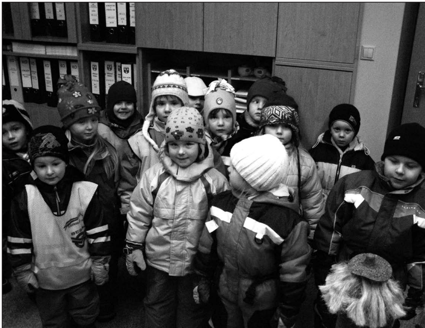
Děti z MŠ Kamínek na návštěvě na Městském úřadě.