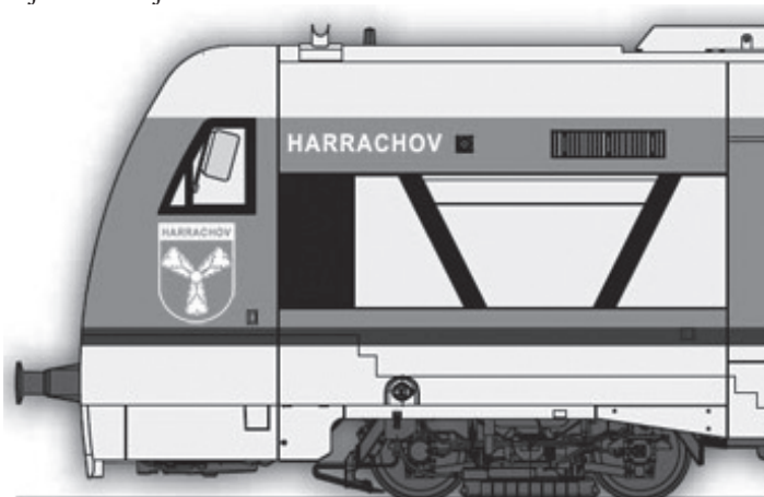
Stadler Regio-Shuttle RS1.

klimatizovaného a bezbariérového vozu si může sednout 71 lidí, 20 sedaček je sklopných. Navíc jsou zde i místa pro jízdní kola a lyže. Ve vlaku si také můžete nabít mobilní telefon či zapojit notebook, jsou zde totiž elektrické zásuvky. Klimatizace je samozřejmostí.