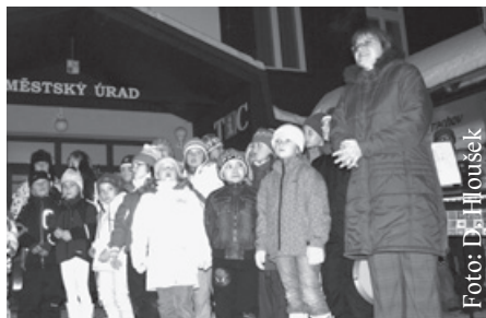
Tradiční Advent s Andílky z Čertáku

Harrachov je už skoro 15 let mým domovem, žiji tu lidi, které mám ráda. Ale mnoho lidí mi tu chybí a to se mi moc nelíbí. Proto tu a tam z Harrachova odjíždím, ale pak se zase ráda vrátím. Ve všem ostatním se dokážu přizpůsobit nebo přijímám věci tak, jak jsou.